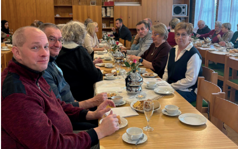
Ortsräte und Kirche - Hand in Hand